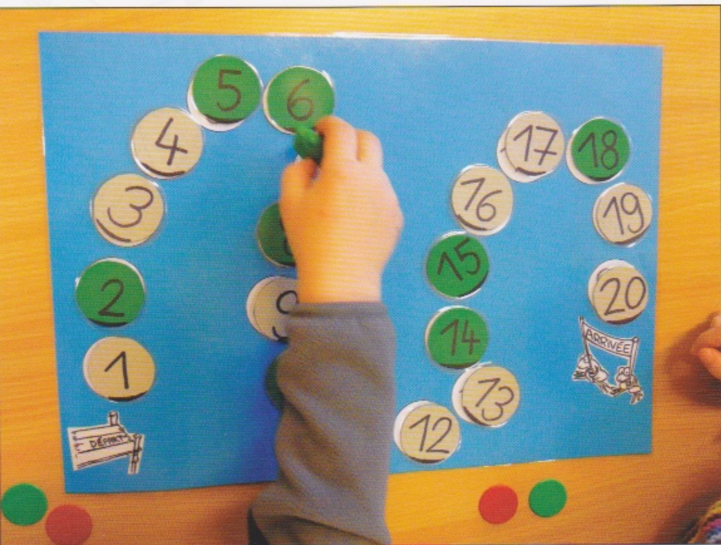
Réciter la comptine numérique sans dire les nombres où se trouvent un nénuphar (jeton vert).